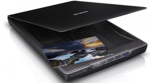
Epson Perfection V39 Scanner