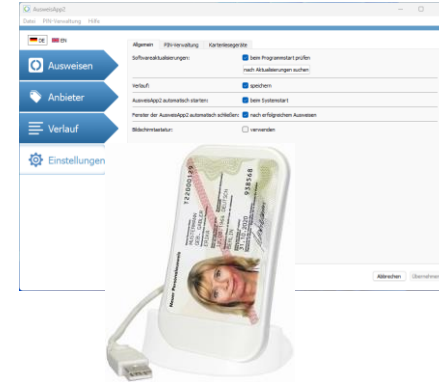
SmartCard Reader von SCM für die AusweisApp2

Intel Core i5 8500 hexa-core (6 cores) @ 3.0 - 4.1 GHz CPU Intel UHD Graphics 630 - Max. Auflösung: 4096 x 2304 NVIDIA Quadro P400 GPU, 2GB GDDR5, 64bit 32 GB RAM @ 2666 MHz – 2x 16 GB DDR4-2666 UDIMM Optical Drive: Slim 9.5 mm SATA DVD+/-RW drive 1x 1 TB SSD Samsung 970 EVO Plus NVMe M.2 mit Heatsink 1x 1GbE Realtek RJ45 Port, 1x 2.5GbE Realtek RJ45 Port Windows 11 Pro Version 23H2 (Mitglied in einer lokalen Domain) Microsoft Office Professional Plus 2019 / Visio Professional 2019 AusweisApp2 / WISO Steuer 2023 / Gamin Express u.a. Web-Browser: Chrome, Edge und Mozilla Firefox Epson Perfection V39 Scanner DIN A4, 4.800 dpi, USB 2.0 EPSON Scan Software