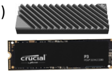
1 TB SSD Crucial NVMe M.2 mit Heatsink

Intel Core i3-12100T quad-core (4 cores) @ 2.2 – 4.1 GHz CPU Intel UHD Graphics 730 – 1x HDMI / 1x DisplayPort: 4096 x 2304 (4K-Auflösung) 16 GB RAM @ 3200 MHz – 2x 8 GB DDR4-3200 UDIMM 1x 1 TB SSD Crucial P3 NVMe M.2 mit Heatsink 1x 1GbE Realtek RJ45 Port, 1x 2.5GbE Realtek USB 3.0 auf RJ45 Port 1x MediaTek WiFi 6 MT7921 Wireless LAN Card mit Bluetooth und interner Antenne Windows 11 Pro Version 23H2 (Mitglied in einer lokalen Domain) Microsoft 365 Apps for Enterprise, Project Pro 2019 (Office Anwendungen) Microsoft Teams / Microsoft Clipchamp Web-Browser: Chrome, Edge und Mozilla Firefox Foxit PDF Reader / VLC media player / Acronis True Image for Crucial